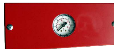
BIP01 avec 1 manomètre pour coffret Ouverture seule et Ouverture Fermeture