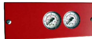
BIP02 avec 2 manomètres pour coffret Bizone

Matière . . . . . : Acier, laiton, alu, matières synthétiques. Protection . . . . . : Peinture. Pression de service maxi. . . . . : 60 bar. Pression d'utilisation maxi. . . . . : 60 bar. Raccordement . . . . . : Raccord à olive pour tube Ø 6. Température d'utilisation. . . . . : + 5°C à + 50°C .Précautions . . . . . : Stockage et installation à l'abri des intempéries.